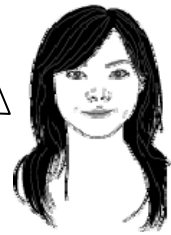
【編集員：ハルちゃん】

さて、私事ですが、H20年8月に男の子が生まれ、すでに1歳半近くになりました。日々の育児は大変だけど結構楽しいものです。その間、育児休業を取らせて頂き、H21年4月に復職しております。これからも仕事に育児にがんばるぞ！