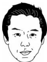
[主任編集員：まさお君]